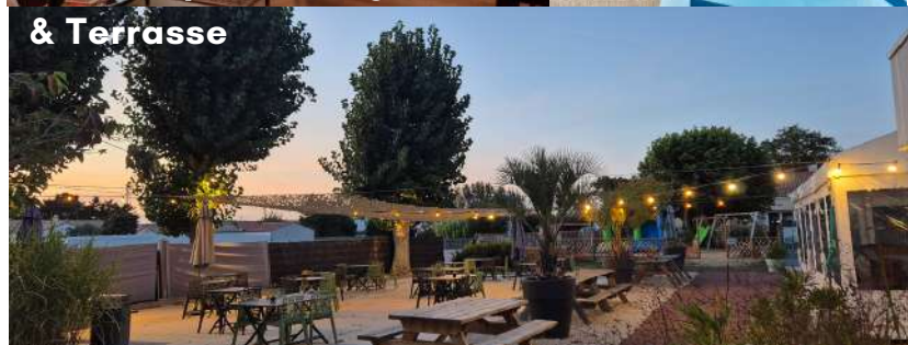
Aire de jeu attenante à la terrasse

Structure gonflable uniquement juillet/août